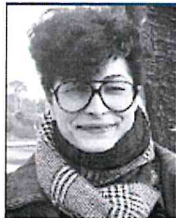
Libya SENOUSI Directrice du périscolaire