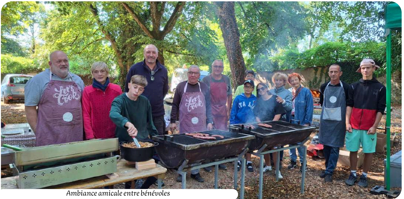
Ambiance amicale entre bénévoles

Avec plus de 130 exposants, la brocante 2025 a connu un grand succès. Le soleil était de la partie et les visiteurs nombreux. L'enthousiasme et l'engagement des bouxiérois ont grandement contribué au succès de cet événement, créant une atmosphère conviviale et animée.