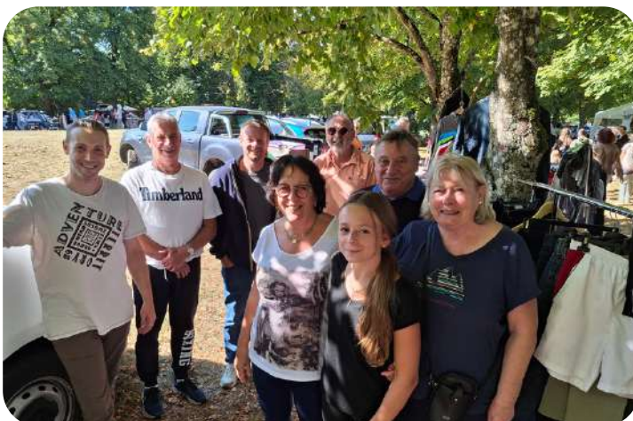
Famille Nuel et leurs voisins aux Noisetiers comme à la brocante !